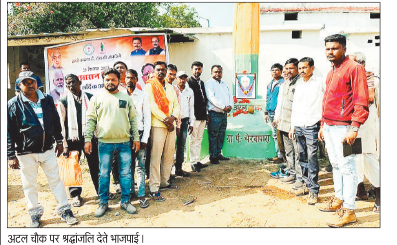
अटल चौक पर श्रद्धांजलि देते भाजपाई।

रेख के अभाव में जर्जर होने लगे और कई तो जीर्ण-शीर्ण हो गए। अब प्रदेश में भाजपा की सरकार सत्ता में आने के बाद फिर से ग्राम पंचायतों में उपेक्षित हो चुके अटल स्तंभ का फिर से जीर्णोद्धार करने का कार्य शुरू कर दिया। यह कार्य तैयार से किया गया जिससे कि उपेक्षित अटल स्तंभ का मरम्मत कार्य कराकर रंग-रोशन कर चकाचक कर दिया गया, क्योंकि 25 दिसंबर को स्व. अटल बिहारी बाजपेयी का जन्म दिवस अटल स्तंभ में ही भाजपाईयों ने मनाया गया।