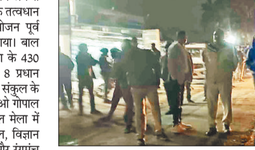
हरिभूमि न्यूज ▶▶ अम्बिकापुर/राजपुर

पिछले एक पखवाड़े से राजपुर जंगल में सक्रिय 27 सदस्यीय हाथियों ने बीती रात एनएच 343 को जाम कर दिया। हाथी रात में एनएच को पार कर धौरपुर जंगल की ओर रवाना हो गए। हाथियों के जाने से क्षेत्र के किसानों एवं वन अमले ने राहत की सांस ली है। लम्बे समय तक प्रतापपुर जंगल में सक्रिय 28 सदस्यीय हाथियों का बड़ा दल एक पखवाड़े से वन परिक्षेत्र राजपुर में भ्रमण कर रहा था। कुछ दिनों पूर्व कर्ट से एक हाथी की मौत होने के बाद हाथी लगातार धौरपुर जंगल की ओर जाने की कोशिशें कर रहे थे लेकिन क्षेत्र के ग्रामीणों द्वारा रास्ता बाधित करने एवं लगातार छेड़छाड़ करने के कारण हाथी अपना मार्ग छोड़कर भटक जाते थे। चार दिनों तक ग्राम करवां एवं गोपालपुर जंगल में गुजारने के बाद पिछले एक सप्ताह से हाथियों का दल चांची जंगल में मौजूद था तथा लगातार धान व गन्ना की फसल को तबाह कर रहा था। फसल से अपनी भूख मिटाने के बाद हाथी जब भी आगे बढ़ने की कोशिश करते ग्रामीण पटाखे फोड़कर हाथियों का रास्ता बाधित कर देते थे। वन अमले द्वारा हाथियों के आक्रोशित होने पर अधिक क्षति पहुंचाने एवं हाथियों से दूर रहने की समझाईश का ग्रामीणों पर कोई प्रभाव नहीं पड़ने एवं हाथियों द्वारा जनहानि करने के भय से वन अमला पूरी रात हाथियों की चौकसी कर रहा था। बीती रात हाथियों के एनएच की ओर बढ़ते देख वन अमला पूरी रात सक्रिय रहा। इस दौरान हाथियों ने तीन बार एनएच को पार करने की कोशिश की।