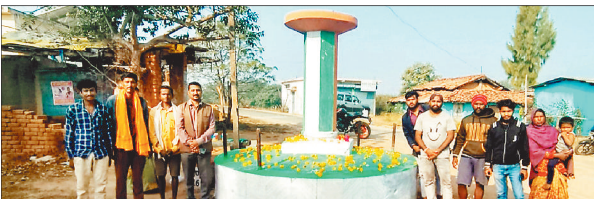
अटल स्तंभ पर एकत्रित होकर पूर्व प्रधानमंत्री को श्रद्धांजलि देते ग्रामीण।

देश के पूर्व प्रधानमंत्री स्व. अटल बिहारी बाजपेयी का जन्म दिवस 25 दिसंबर को भाजपाईयों के द्वारा सुशासन दिवस मनाया गया। इस अवसर पर जिलेभर के ग्राम पंचायतों में स्थित अटल स्तंभ पर स्व. बाजपेयी का छायाचित्र रखकर माल्यार्पण एवं पुष्पांजलि अर्पित कर उनका जन्म दिवस मनाया गया। जिलेभर के ग्राम पंचायतों में भाजपा पदाधिकारियों में स्व. अटल बिहारी बाजपेयी का जन्म दिवस को उल्लास के साथ मनाया गया। इस अवसर पर उनके द्वारा देश के विकास के लिए किए कार्यों को याद किया गया। भाजपा पदाधिकारियों ने उपस्थित लोगों को संबोधित करते हुए कहा कि छग प्रदेश के निर्माता स्व. अटल बिहारी बाजपेयी ही रहे।