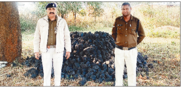
पुलिस द्वारा पकड़ा गया कोयला।