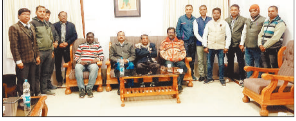
बैठक उपस्थित अधिकारी-कर्मचारी।

कोरिया कर्मचारी-अधिकारी फेडरेशन का वार्षिक कैलेंडर का शीघ्र प्रकाशन किया जाएगा। महिला कर्मचारियों की सहभागिता बढ़ाने के उद्देश्य से महिला प्रकोष्ठ का गठन किए जाने का निर्णय लिया गया। फेडरेशन प्रांतीय पदाधिकारियों से डीए की देय राशि शीघ्र प्रदाय करने के लिए वार्ता करने का निर्णय लिया गया। बैठक में प्रस्ताव पारित किया गया कि कर्मचारी-अधिकारी फेडरेशन कोरिया कर्मचारियों के हित के लिए पूर्ववत संघर्ष करेगा। विदित हो कि कर्मचारी-अधिकारी फेडरेशन प्रदेश का सबसे बड़ा संगठन है, जो विगत कई वर्षों से कर्मचारी हित में संघर्ष करता रहा है और कर्मचारियों को न्याय और उनका हक अधिकार